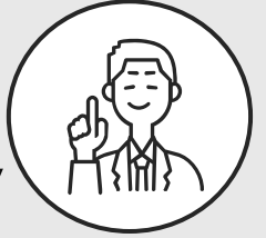
関西出身 採用担当

仕事で必要な知識や経験は、どんな人でも一気に増えることはありませんので、研修や実践を通して1日に1つずつでも身につけていっていただければと思います。しっかりとサポートしますので安心してください！