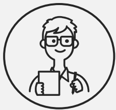
大学4年生 Rさん ほか