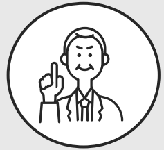
関西出身 営業職2年目

はじめての一人暮らしに不安もありましたが、同僚と週末に観光することもあり、未開の街を開拓する楽しさを味わっています。