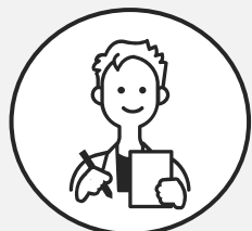
大学3年生 Aさん ほか