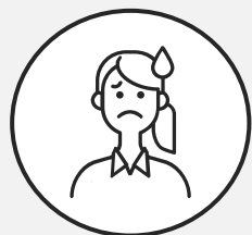
大学4年生 Nさん ほか