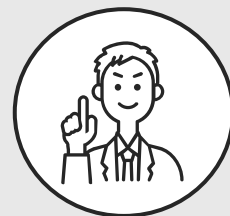
中部出身 営業職2年目

外からわかることは多くありませんが、調べる過程で自分 がどんな業務に就きたいかが見えてきて、「何をしたいか」 という質問にもしっかり回答できるようになりました。