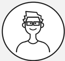
大学4年生 Yさん ほか