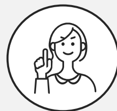
関西出身 営業2年目

仕事中はもちろん厳しさもありますが、それもお客様や 製品に真剣に向き合っているからこそ。尊敬しています。