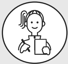
大学4年生 Iさん ほか