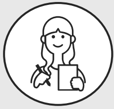
大学3年生 Oさん ほか