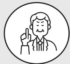
関東出身 営業職5年目

今は名古屋に住んでいますが、賃貸物件の借上げ社宅なので想像よりも広くてキレイでした。家賃負担も賃料の3割ほどなのでかなり助かっています。