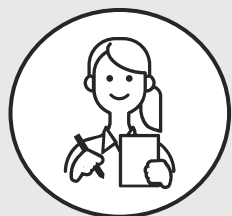
大学4年生 Sさん ほか