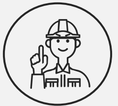
関東出身 技術職3年目

80年を超える歴史ある工場ですが、近年では「工場の魅せる化」や自動化・デジタル化にも注力していて、明るくきれいになり続けているような印象もあります。