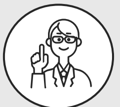
関東出身 事務職3年目

聞いたら何でも教えてくれる職場なのですが、教えてもらってばかりでは身につかないと思い、自分なりに考えてから質問するようになりました。そうしているうちに少しずつ力もついて、認めてもらえるようになった気がします。