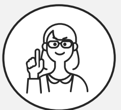
関西出身 営業職5年目

終業後は近くの居酒屋で、ベテラン社員に仕事の相談に乗ってもらったりすることも。残業は減らす方向にあり、休日出勤もないので、公私ともに充実しています。