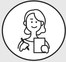
大学4年生 Hさん ほか