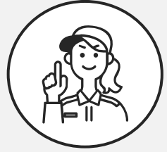
九州出身 技術職2年目

東芝グループ各社の新人と野外学習でカレーを作る機会もあり、同じような不安を共有したり、励まし合ったりしているうちに「私も頑張ろう」という気持ちになりました。